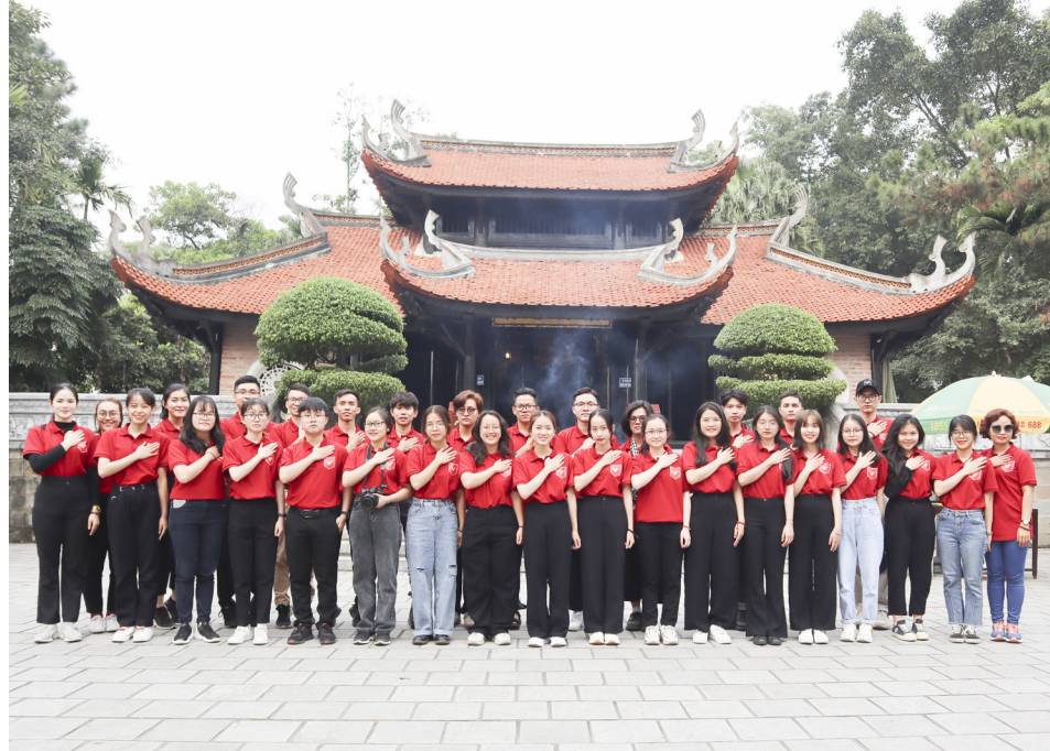
Đoàn Sinh viên tiêu biểu đại diện tham quan, học tập tại Đền Hùng năm 2020